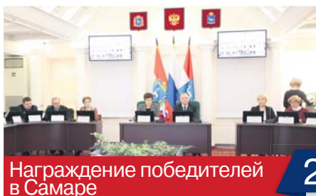
Награждение победителей в Самаре