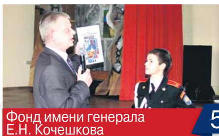
Фонд имени генерала Е.Н. Кочешкова